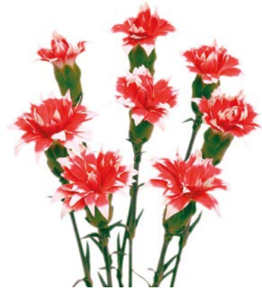
STAR RUBY TESSINO