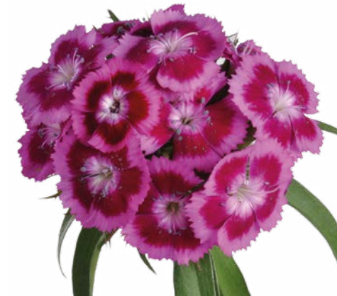
ALDO VIOLA FANTASIA