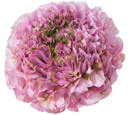
PON PON® AURORA