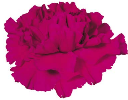
TICO TICO VIOLA