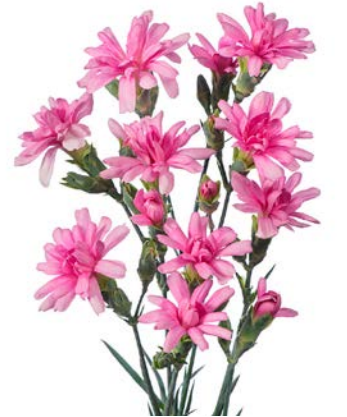
MINI TIARA LILAC