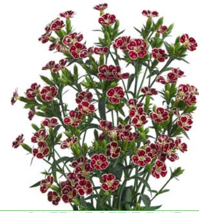
RAFFINE PETIT FAYE