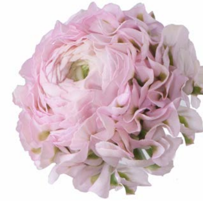
PON PON® HERMIONE