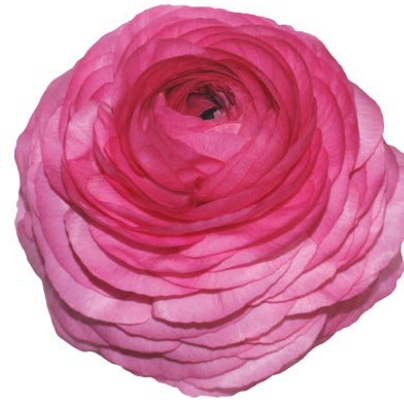
ELEGANCE HOT PINK