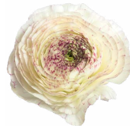
AMANDINE LIGHT CAPPUCCINO