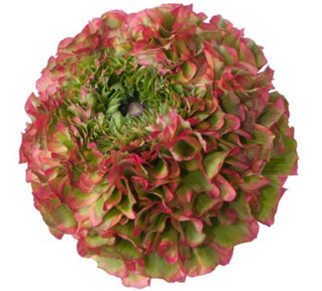
PON PON® FLORA