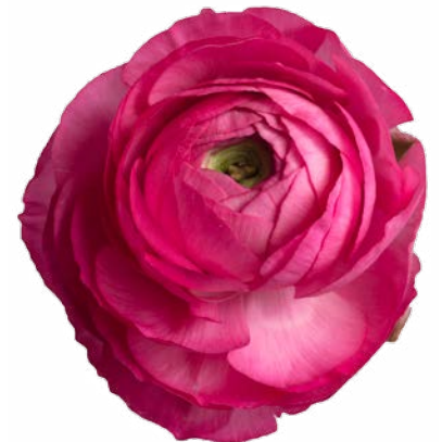
AMANDINE BON BON