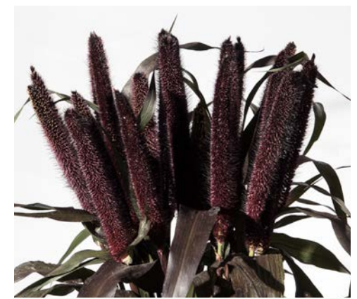
PENNISETUM PURPLE MAJESTIC