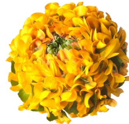
PON PON® MERLINO