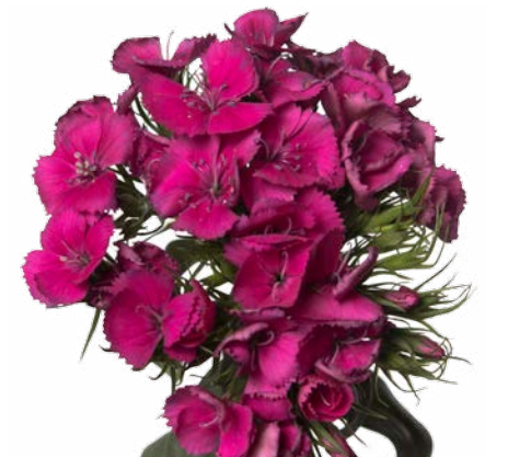
ALDO HOT PINK