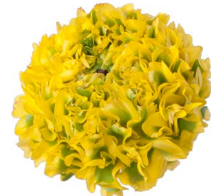
PON PON® STELLA