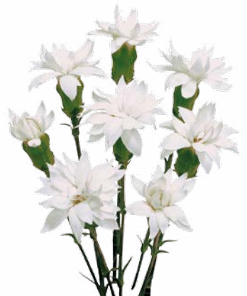
STAR SNOW TESSINO