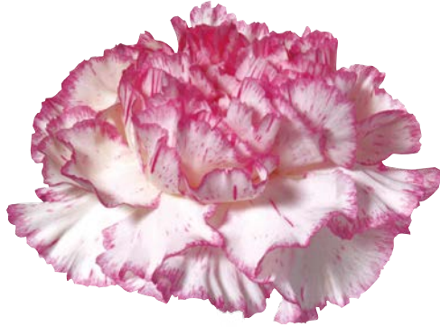
TICO TICO ROSA