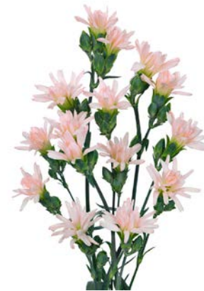
MINI TIARA BABY PINK