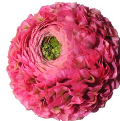
PON PON® FANNY