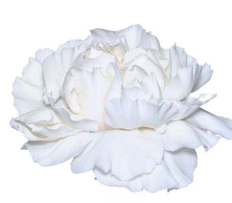
TICO TICO BIANCO