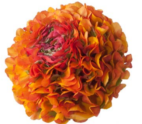
PON PON® TRILLY