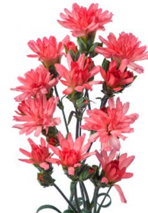
MINI TIARA CORAL PINK