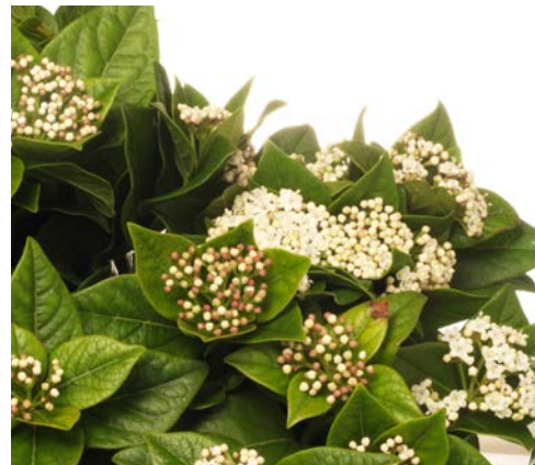
VIBURNUM TINUS MACROPHYLLUM