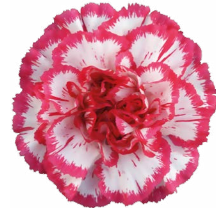
KINO WHITE CRIMSON