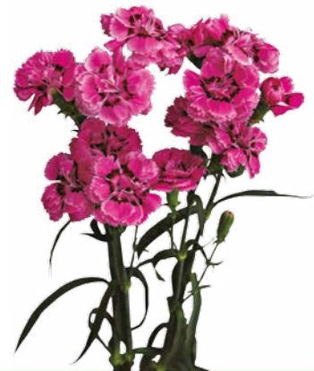
THE SIMPSON'S BOE