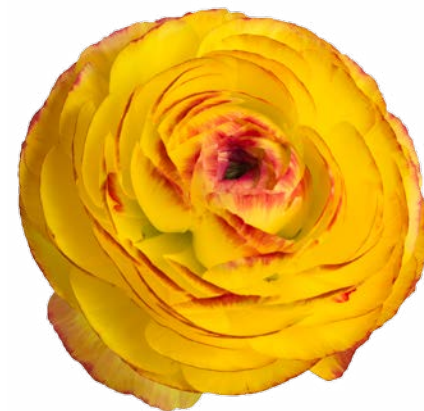
AMANDINE YELLOW PICOTEE