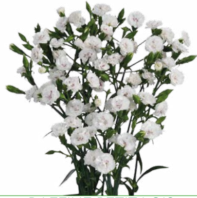
RAFFINE PETIT LOIS