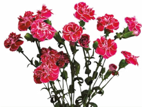
THE SIMPSON'S LISA