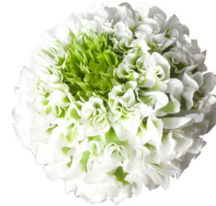
PON PON® IGLOO