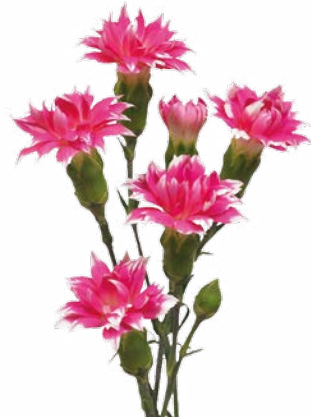
STAR CHERRY TESSINO