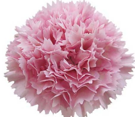
NOBBIO LAVENDER CHIC