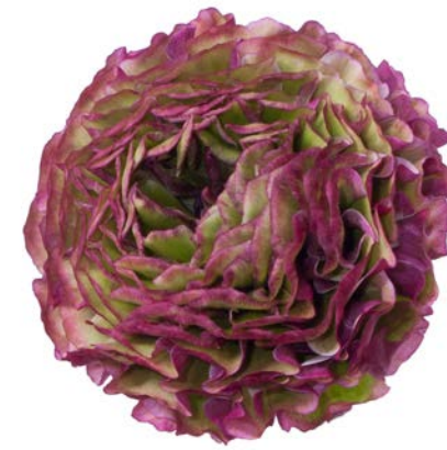
PON PON® MALVA