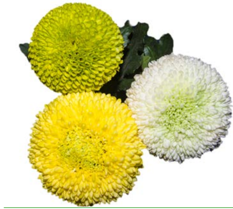
CRISANTEMI BORIS BECKER